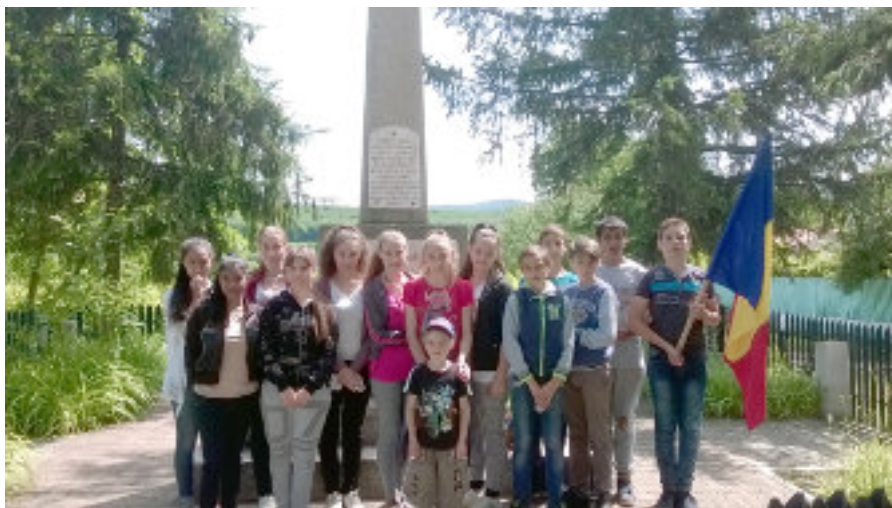
Elevii colii Gimnaziale Hamcearca de Ziua Eroilor

coala Gimnazial Hamcearca, jud. Tulcea elev - Mihail tefan – clasa a VIII-a Coordonator: Mihail Vasilica Lenu a